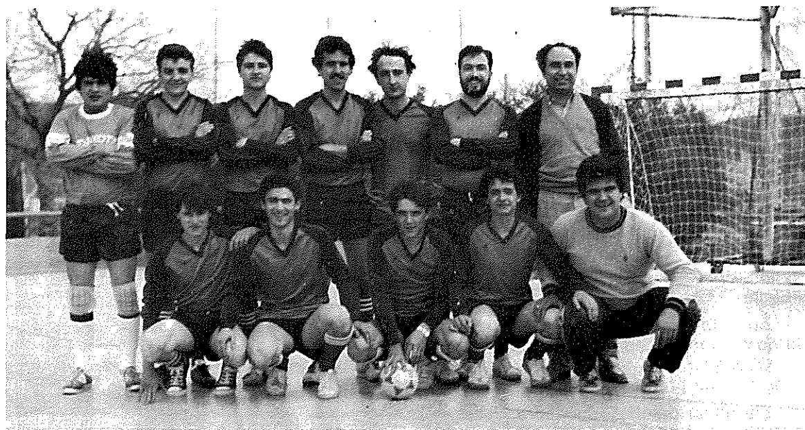
Equip de Futbol-Sala del CCR., el qual va estar present al «Torneig de Semana Santa»