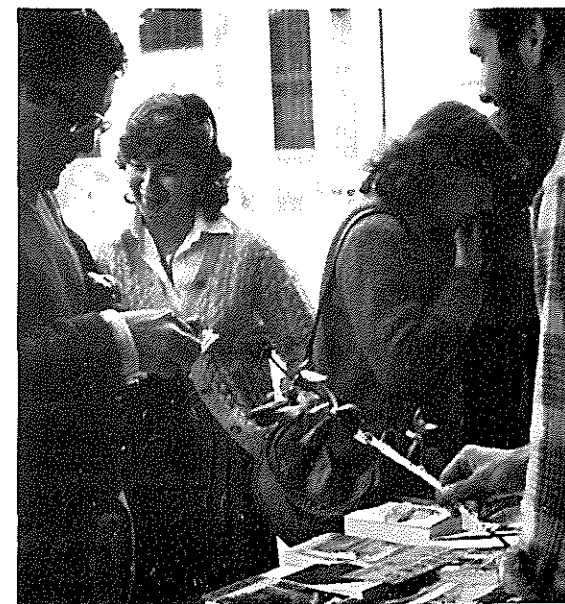
«Venda de Roses i Llibres»

Els socis del C. C. R. tindran un descompte prèvia exhibició del carnet.